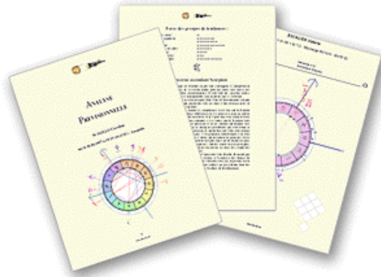
Azimut35 Pro 3 permet la publication d'études astrologiques de haut niveau

6° On est agréablement surpris de l'originalité des options, je pense notamment à la non-interprétation des planètes en signes ou maisons, à l'horloge planétaire dynamique, ou encore à l'évolution des tendances...Pourriez vous nous en dire quelques mots ?